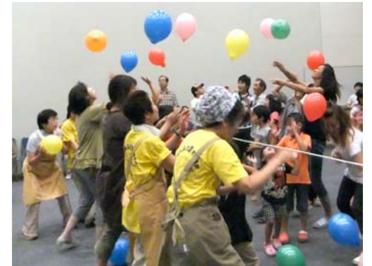
▲風船ゲームは大熱戦