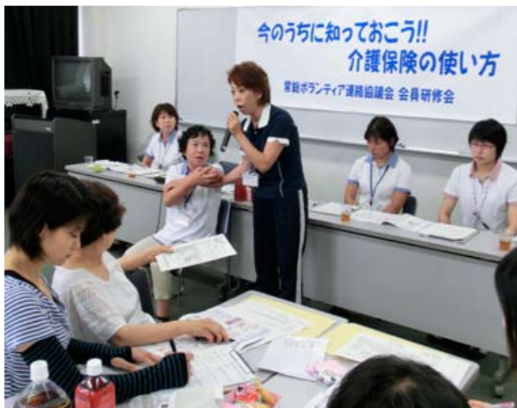
▲とても勉強になりました♪

最後の質疑応答は、時間が足りないくらいで、皆さんの熱心さが伝わりました。また、今度はお互いの身近な介護の問題を語り合う機会があってもいいかなと思いました。