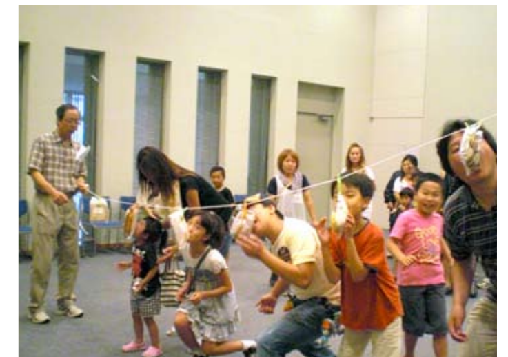
▲パン食い競争ヨーイ、ドン！