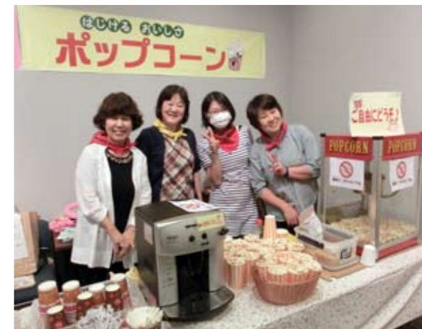
▲スタッフの笑顔もイキイキ