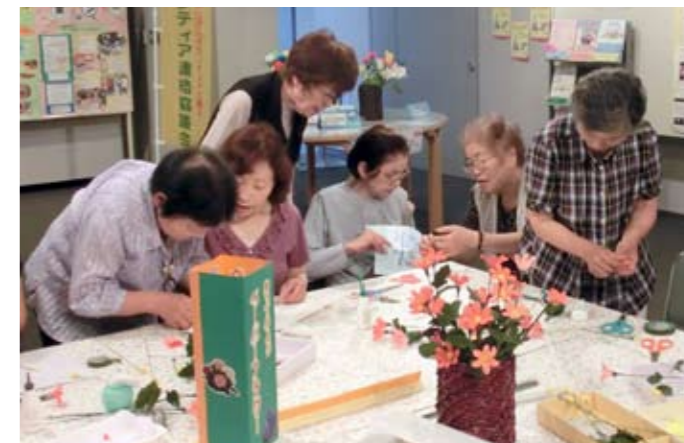
▲ペーパーフラワー体験も大人気