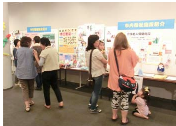
▲福祉施設も参加しました!

カラフルなバルーンでできたアーチをくぐると、かわいいバルーンの動物たちがお出迎え。