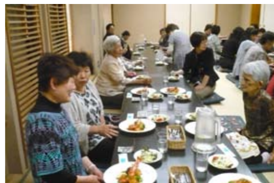
▲いよいよ美味しい食事です