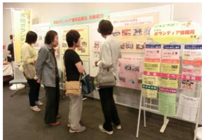
▲パネル展示で活動紹介