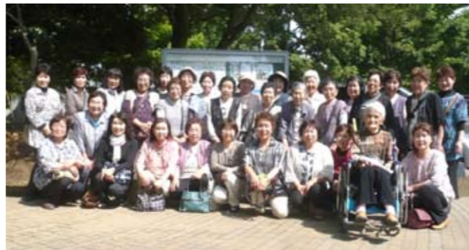
▲今日一日も楽しかったね