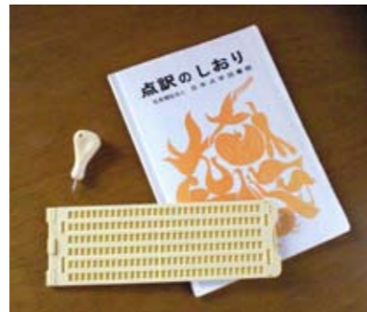
▶点訳のしおりと点字器