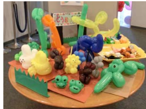
▲バルーンで作った動物園