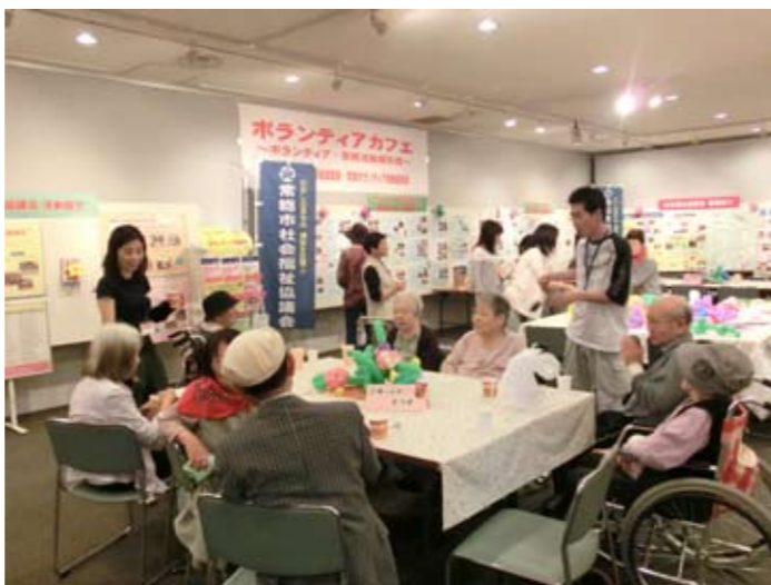
▲アットホームな会場になりました

日ごろ、ボランティアに関わっている私たちでも、市民の方と直接触れ合う機会となり、ますますボランティア活動に励む元気ももらったような気がします。