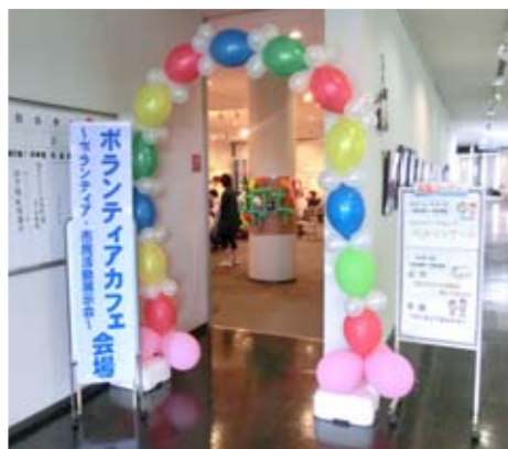
▲ふうせんの会の力作です♪

そんな動物たちを作ってみないと、たくさんの方が挑戦して思った以上の難しさに悪戦苦闘。そして、完成した時には素敵な笑顔が…♪他にも点字や手話、ペーパーフラワーの体験コーナーがありました。体験の後にはコーヒーやお茶でひと休み。