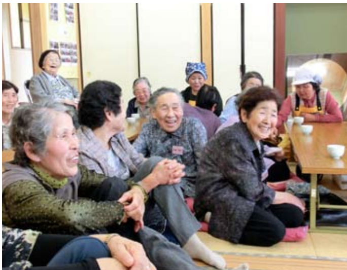
▲自然に笑顔になります