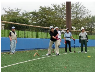
健康長寿をめざして、高齢者スポーツ大会の開催