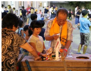
三世代交流イベントで顔の見える地域をつくっています