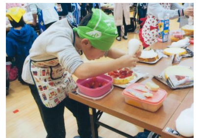
子どもたちがクリスマスケーキづくりに挑戦！