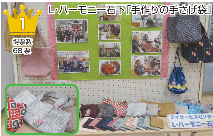
L・ハーモニー石下「手作りの手さげ袋」