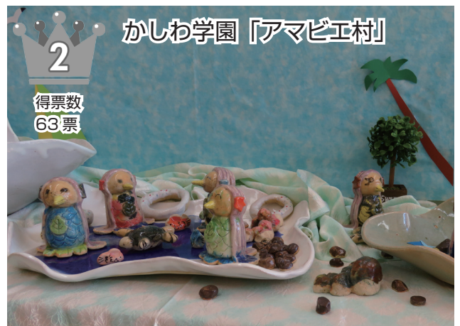
かしわ学園「アマビエ村」