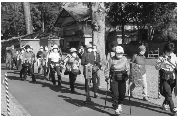
▲ みんなで歩くとあつという間でした。

11月24日、26日に会員交流会（歩く会）を開催しました。2年ぶりの交流会では、秋晴れの中、あすなろの里から一言主神社までの2kmのコースを歩きました。参加者は「久しぶりに仲間とおしゃべりができて楽しかった」と話していました。