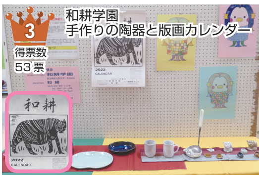
和耕学園 手作りの陶器と版画カレンダー