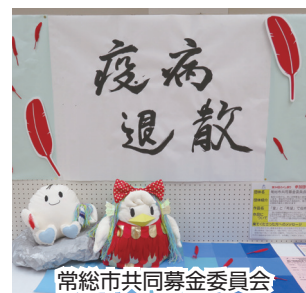
常総市共同募金委員会