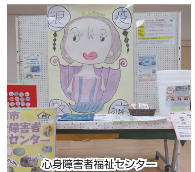
心身障害者福祉センター