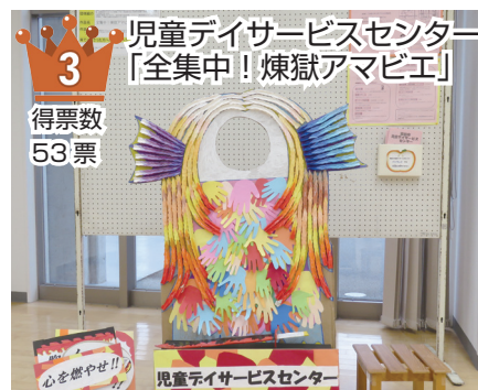
児童デイサービスセンター 「全集中！煉獄アマビエ」