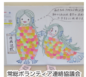
常総ボランティア連絡協議会