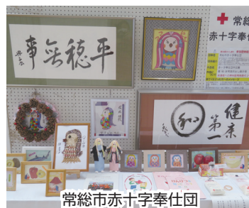
常総市赤十字奉仕団