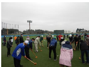
地域みんなで新しいスポーツに挑戦！