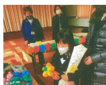
地域で新入生をお祝いしました