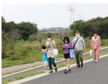
コロナに負けず、歩く会で世代間交流