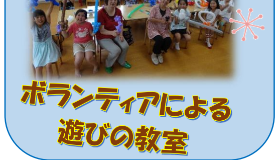
ボランティアによる 遊びの教室