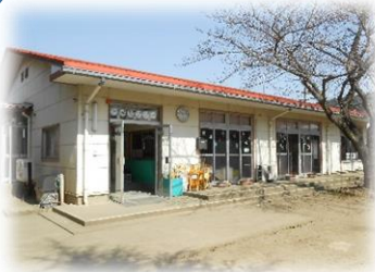
水海道児童センター

児童館は月曜日から金曜日まで自由に遊びに来ることができる所ですが、幼児親子向けに、下記の定期的なクラブ、プログラムも行っております。