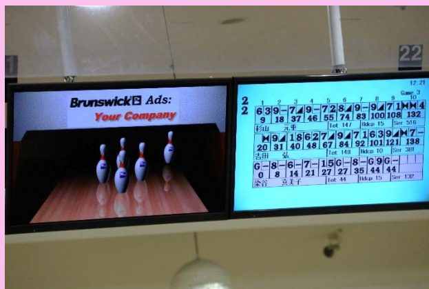
これを取れば、あと1回多く投げられるという大事な局面