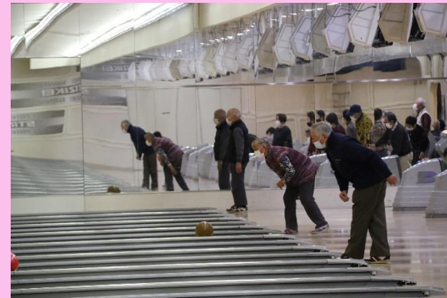
何本倒れたかしら?