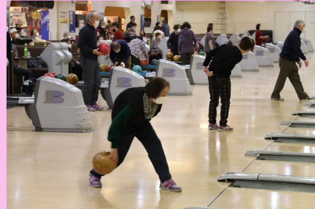
いつでも 元気 ハツラツ!