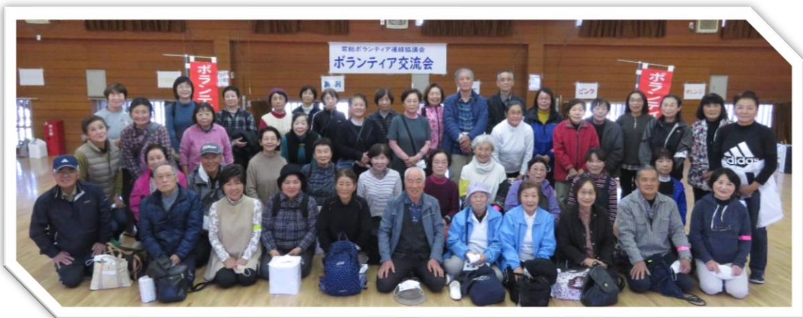
👉 24日参加者 😊

令和3年11月24日(水)・26日(金)の2日間で59名の方が参加しました。コロナ禍でマスク姿ながらも「元気でしたか?」「しばらくぶり!」と笑顔の挨拶。和やかな雰囲気の中いろいろなサークルの方と数人のグループになり、約2kmのウォーキングに出発。晴天の下、秋の自然を満喫し、久しぶりに会えた方と会話を楽しみながらのウォーキングはあっというまの時間でした。