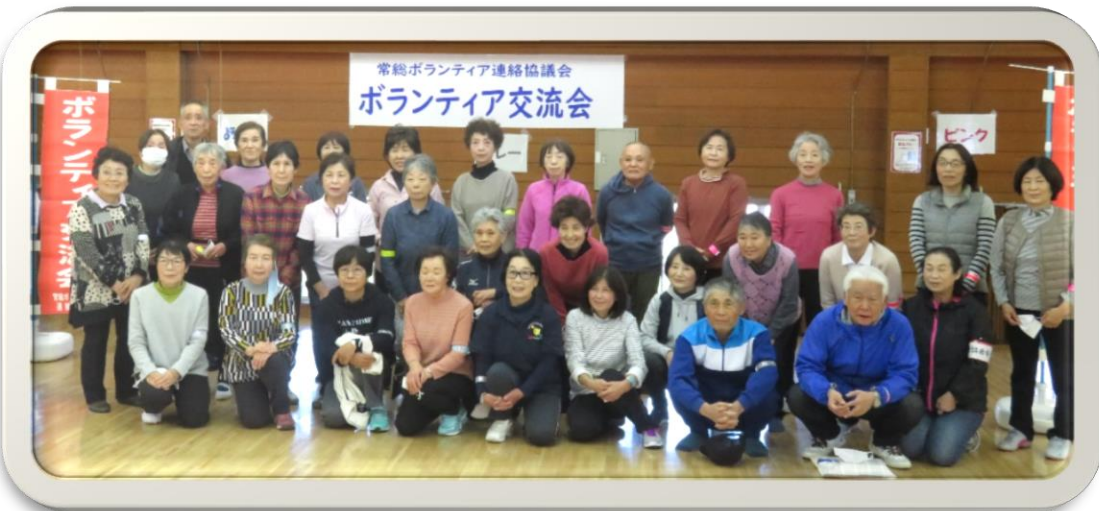
👉 26日参加者 😊

参加者からは、「他のサークルの方と楽しく交流ができ、歩く会の企画も好天に恵まれとても良かった」という声が多く寄せられました。