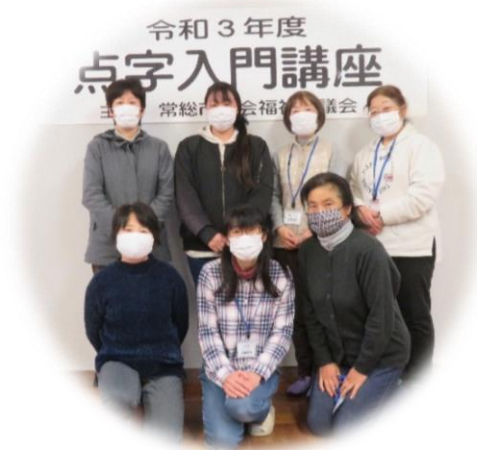
受講者と閉講式にて

私達も初心に振り返っていたことを確認しながら教えることができて良かったと思います。