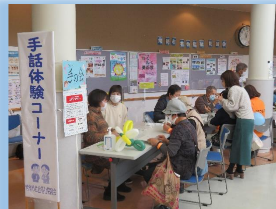
手話体験コーナー

当日は他団体による作品展示や、福祉体験コーナーなど様々なブースがあり、たくさんの来場者でにぎわいました。