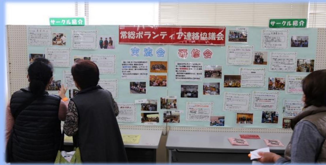
ボ連協 各サークルの活動紹介