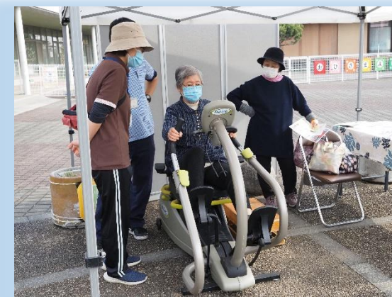
福祉体験コーナー